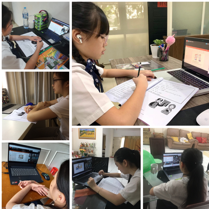
學生線上教學情形。