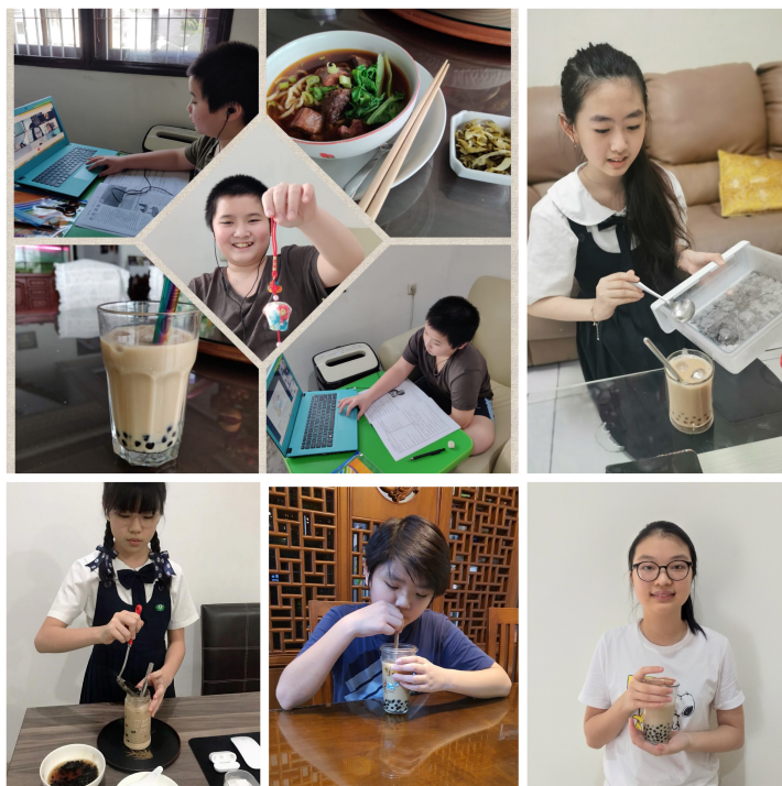
學生動手製作黑糖珍珠奶茶。