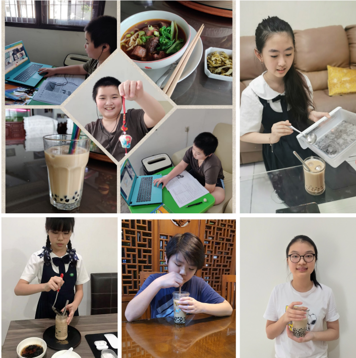
學生動手製作黑糖珍珠奶茶。