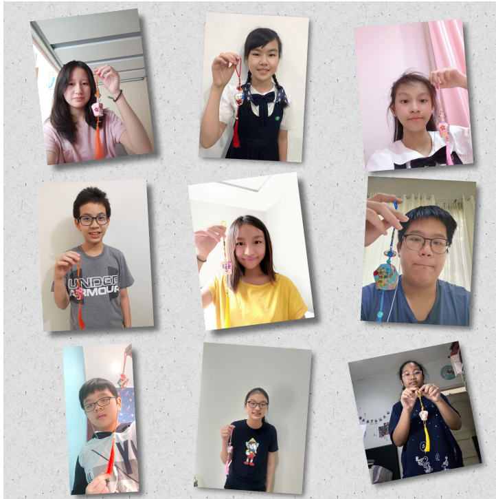
學生手作天燈，祈福一切平安。