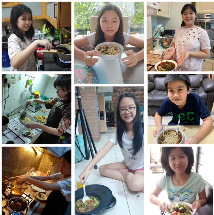
學生自己動手煮紅燒牛肉麵。