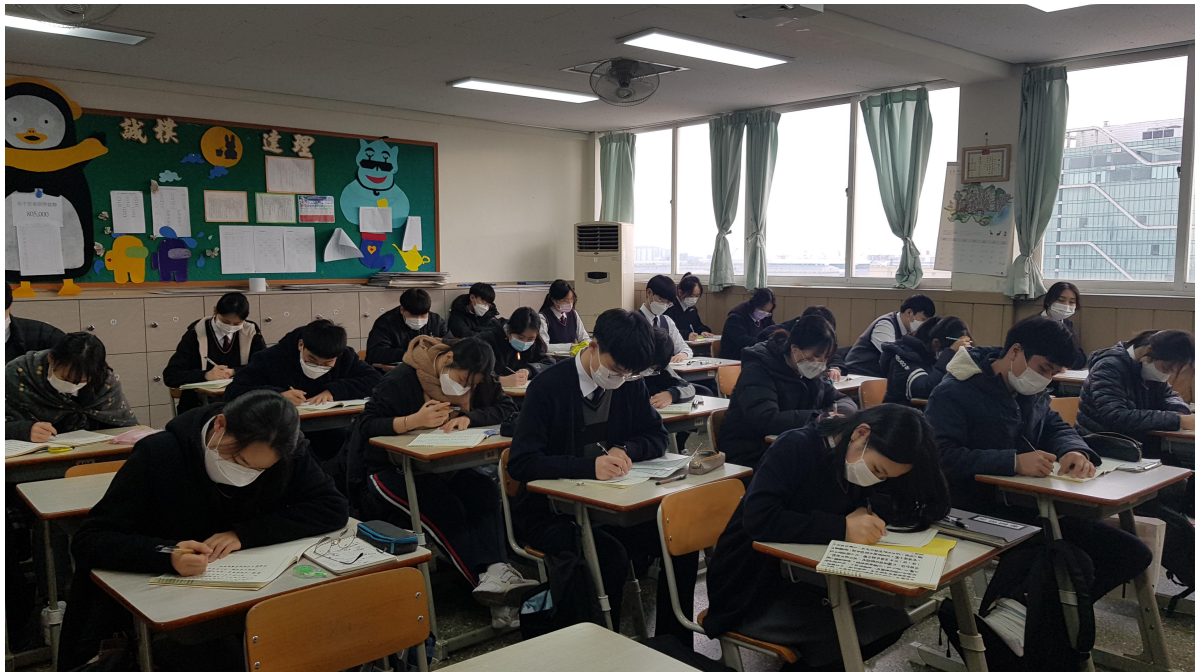
韓國仁川華僑中山中小學 2020 正體漢字文化節活動：作文比賽1