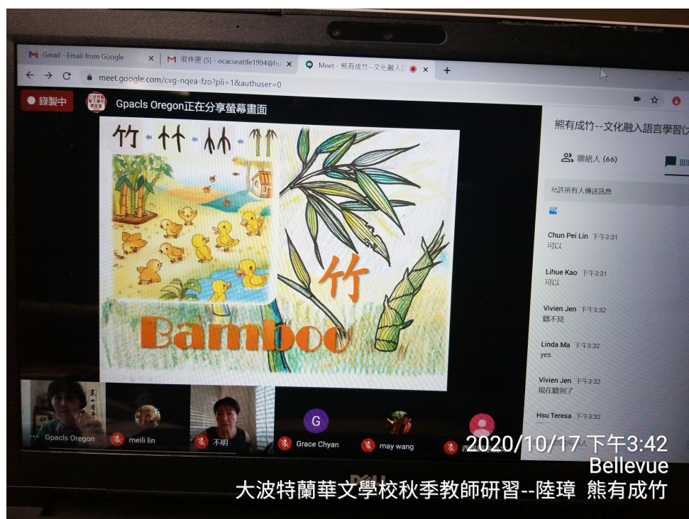
華語課本以「竹」為主題