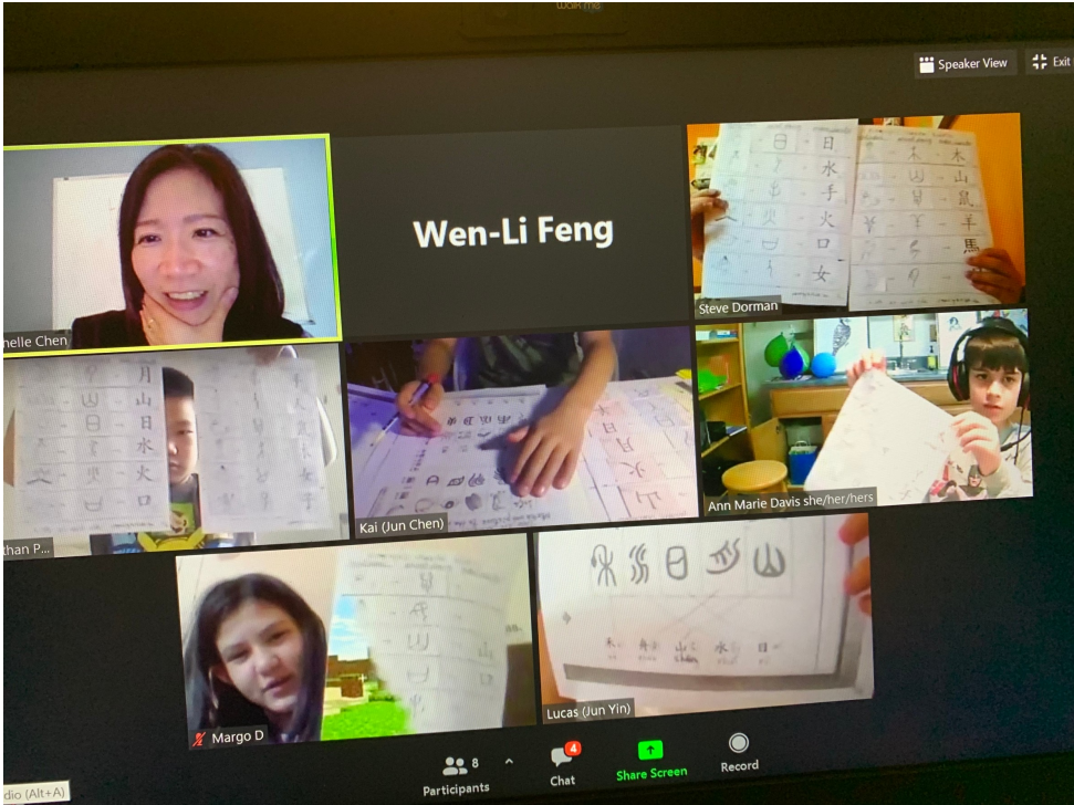
CSL-A：漢字的演化-學生配對象形文字到現代文字