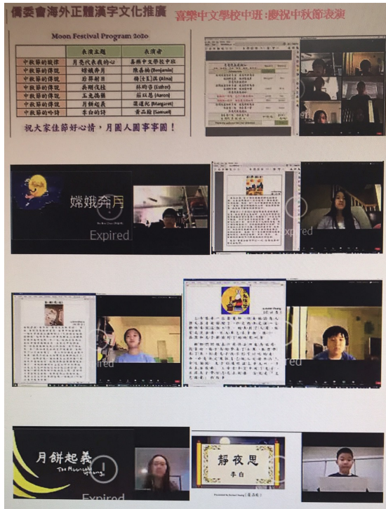
2020-Q3 中班 中秋節說故事比賽