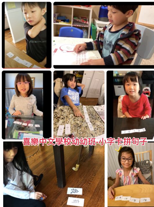
2020-Q3 小小班 小字卡拼句子

雖然，今年不能像往年那樣舉辦中秋節聚餐和晚會，但也發掘出另類且別出心裁的慶祝方式。