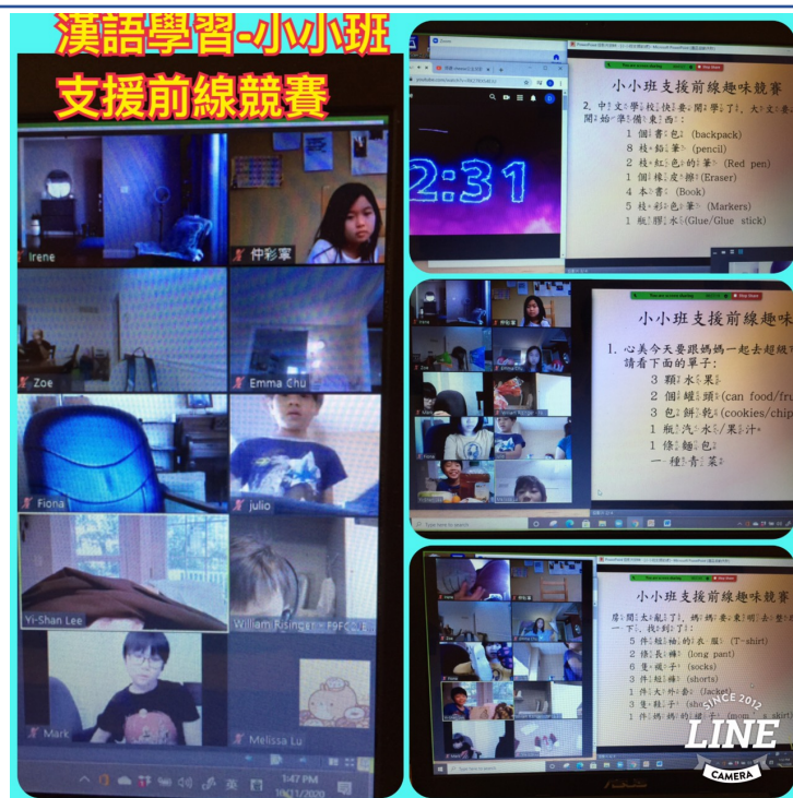
2020-Q3 小小班 支援前線競賽