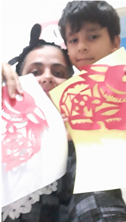
民眾分享完成之作品-玉兔剪紙