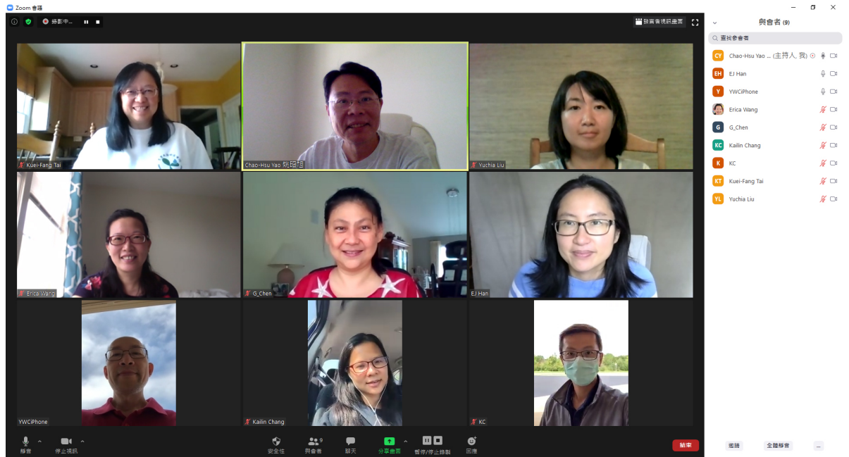
克里夫蘭中文書院 2020 華語文教學網頁製作研討會（線上）3