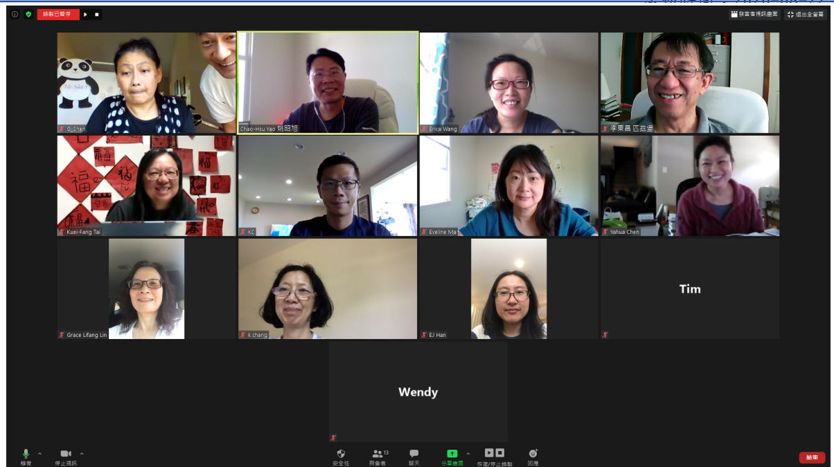
克里夫蘭中文學院 2020 師資培訓活動（線上）4