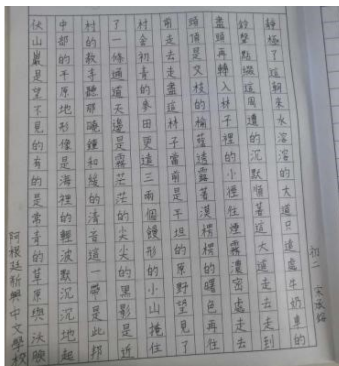
新興教會附屬中文學校 2020 正體漢字文化節活動：硬筆字比賽2