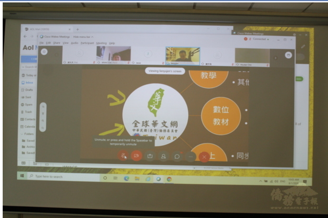
連育仁介紹「全球華文網」豐富的教學資源。