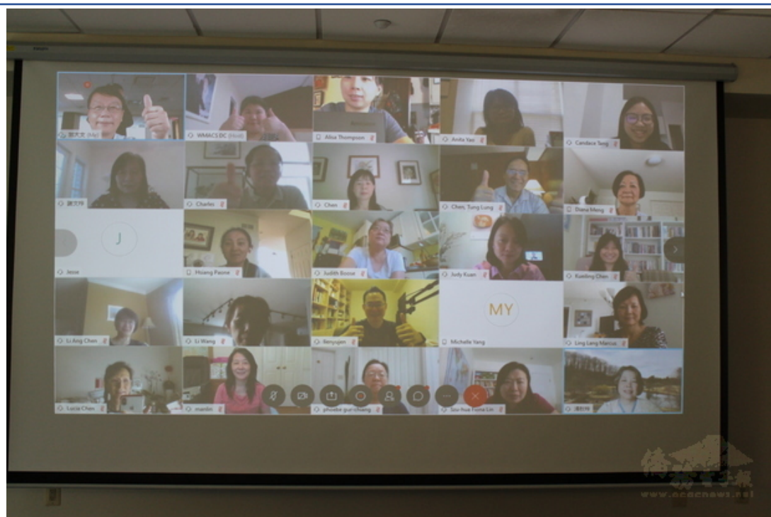
大華府地區2020年華文教師線上研習會學員合影。