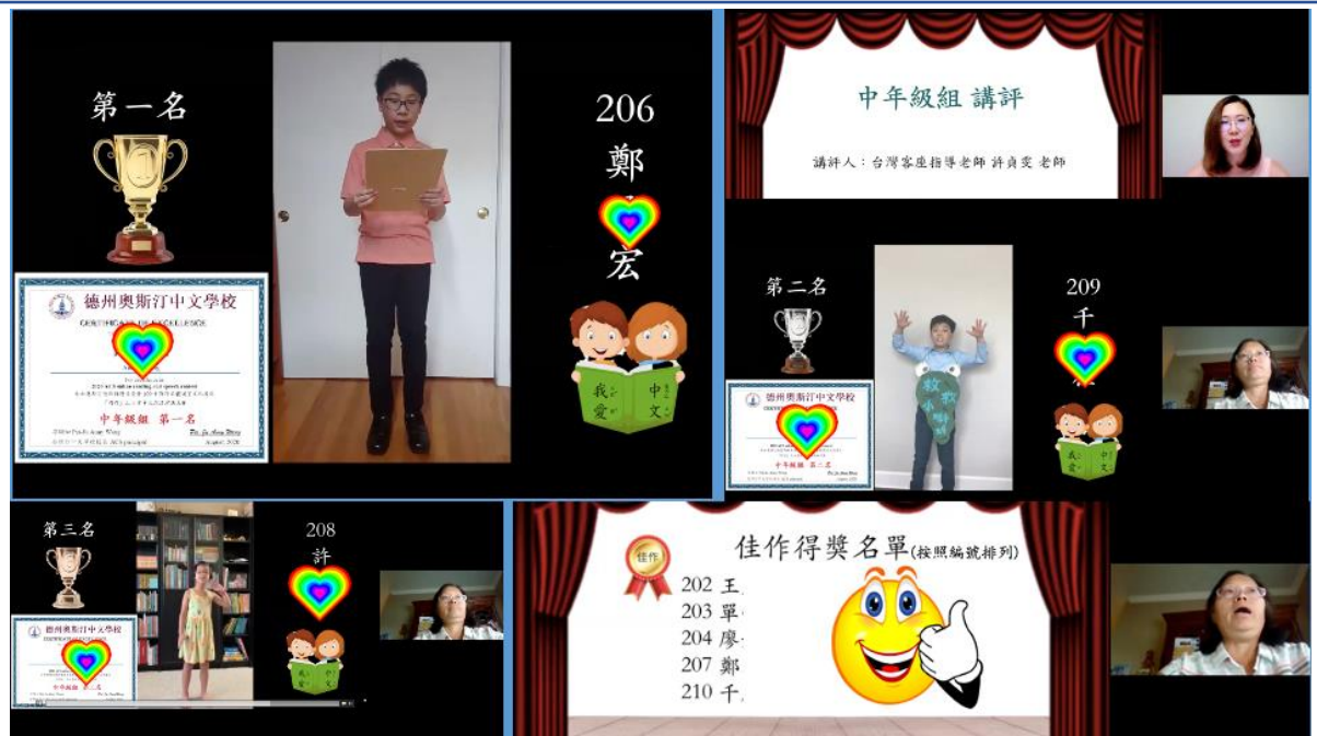
「朗朗」上口秀中文朗讀演講比賽頒獎典禮中年級組得獎名單