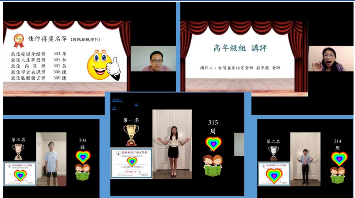
「朗朗」上口秀中文朗讀演講比賽頒獎典禮高年級組得獎名單