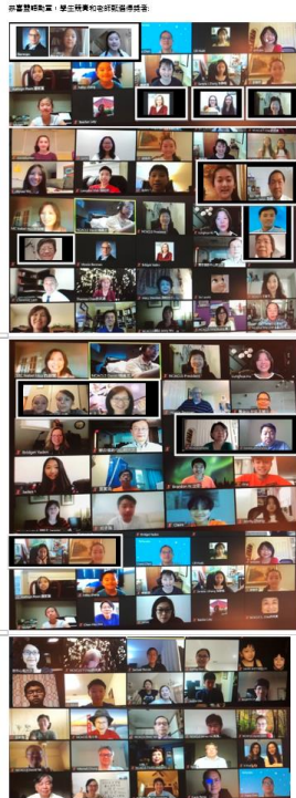
2020年全美中文學校聯合總會年會教師及學藝競賽得獎學生合影留念