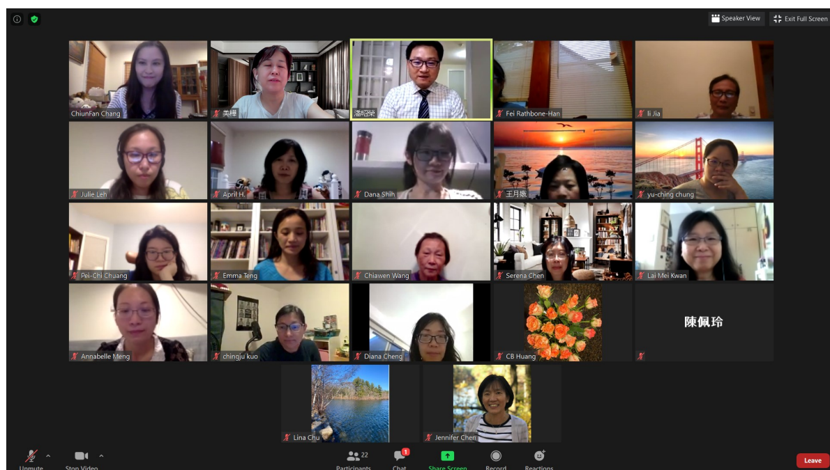
參加線上研習的教師們