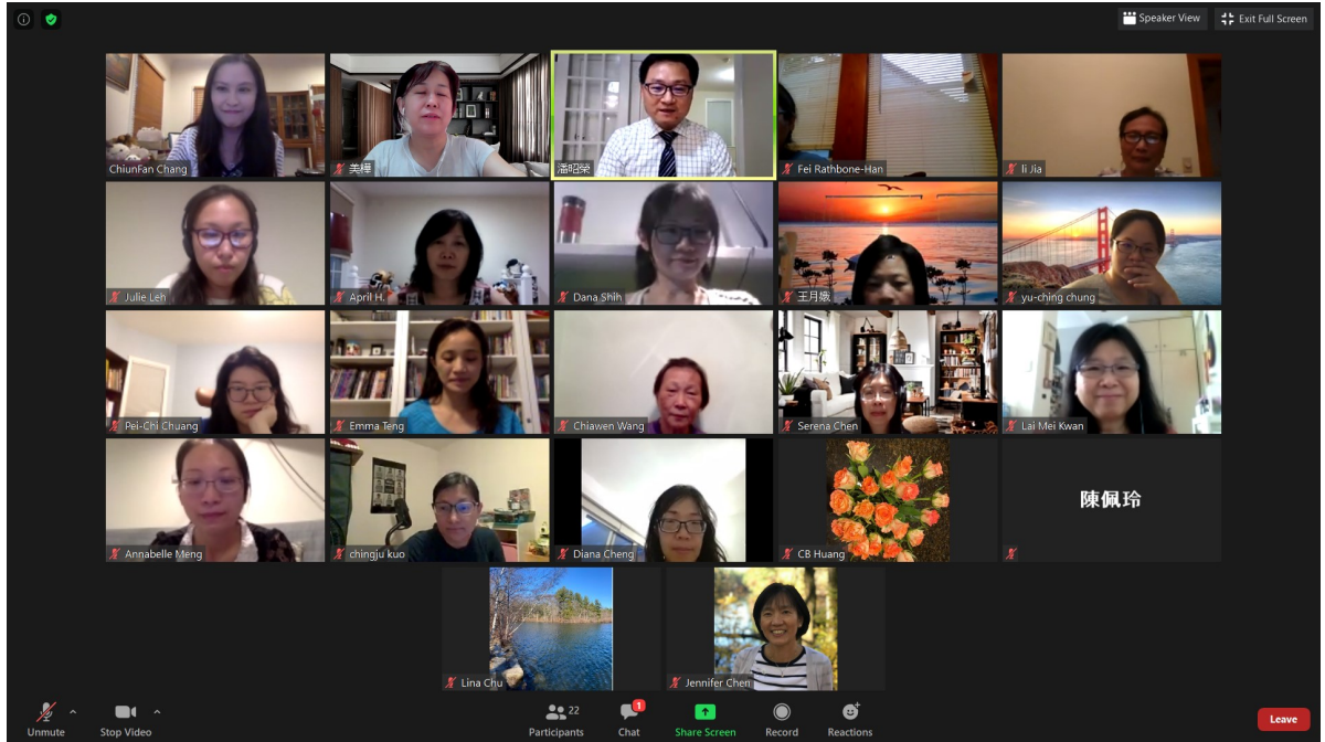
參加線上研習的教師們