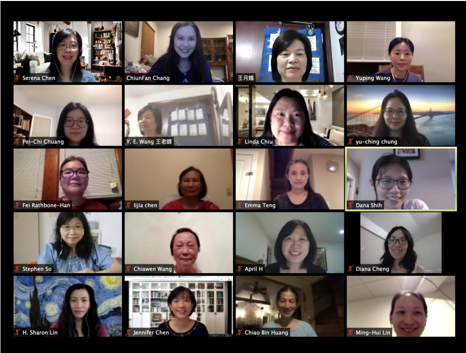
參與的教師們認真上線上課程