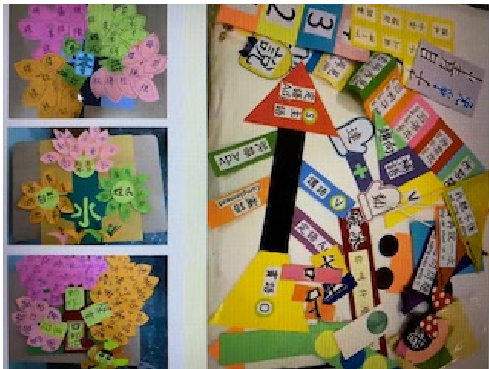
7/18 翻轉教學教具製作

所有參與的教師們也經由本次學習而收穫滿滿，充實了自身的教學資料庫，也都躍躍欲試的期待著秋季開學後能嘗試創新的教學。美西北區華文學校聯誼會也感謝參與教師們的熱誠與鼓勵，更感謝文教中心主任與同仁的協助，順利完成這兩場研習。