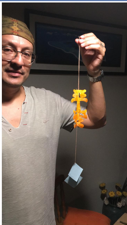
平安字吊飾製作體驗