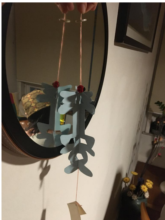
平安字吊飾製作體驗