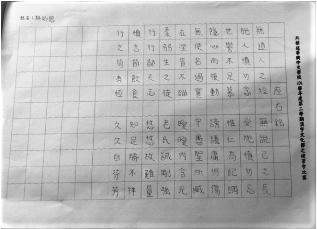
華興中文學校 2020 硬筆字活動2