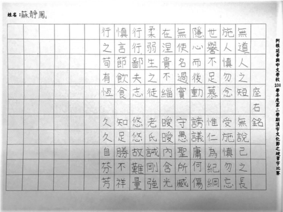
華興中文學校 2020 硬筆字活動3