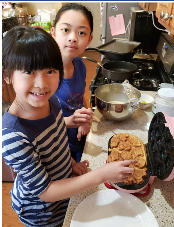
我們的雞蛋糕大成功