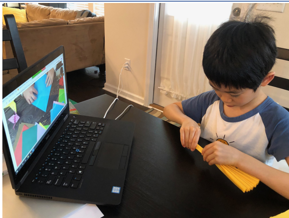
孩子正認真地學習摺紙藝術