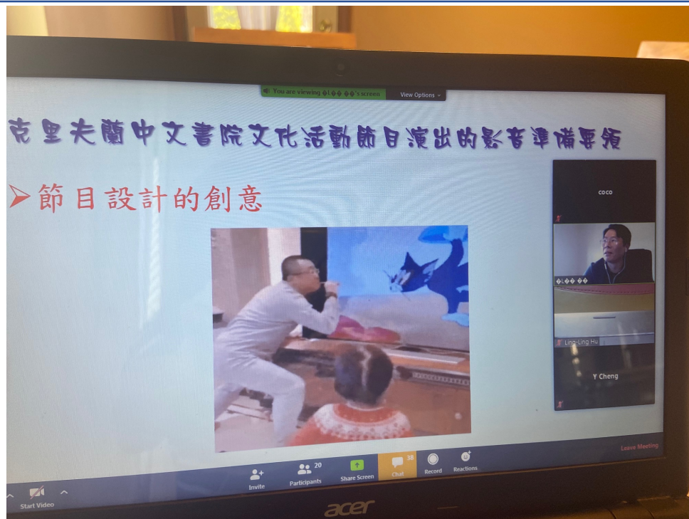
克里夫蘭中文書院 2020數位教學示範點教師培訓（線上）1