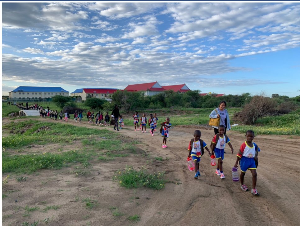
納米比亞圓覺私立學校 中文課說故事～「屋頂」2