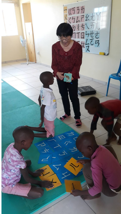
納米比亞圓覺私立學校 中文課說故事～「屋頂」4